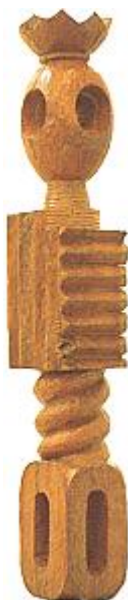
Constantin Brâncuși. Regele regilor